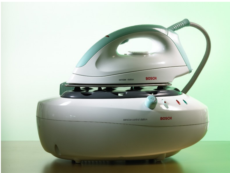
ADN DESIGN. Plancha profesional Sensixx .

Una muestra típica de su trabajo se encuentra en la plancha profesional Sensixx para Bosch, en la que se puede advertir una estética internacionalizada al margen de modas y en la que también se resume, en parte, la tipología de proyectos para un mundo global que asume el estudio.